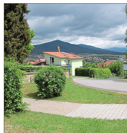
Auch der Bereich oberhalb des Friedhofs wird neu gestaltet, u. a. mit Sitzstufen mit Ausblick zum Kaitersberg.