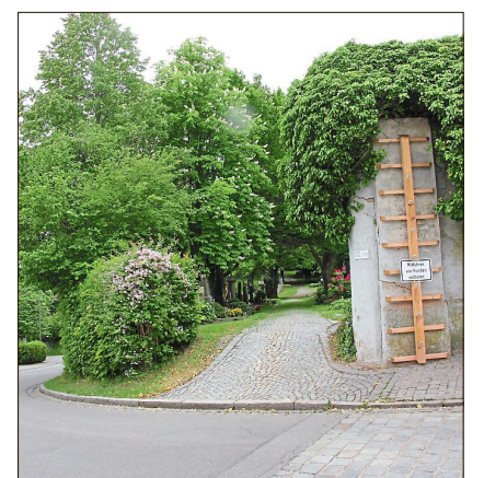
Der Zugang von der Holzapfelstraße zum Alten Friedhof soll geschlossen werden.