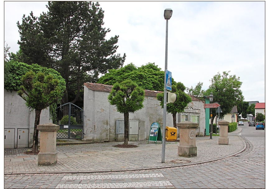
Der Eingang des Alten Friedhofs, wie er seit der Neugestaltung des Torplatzes 1999 aussieht. Nach der Sanierung werden die Pfeiler und Schaltkästen verschwunden sein.