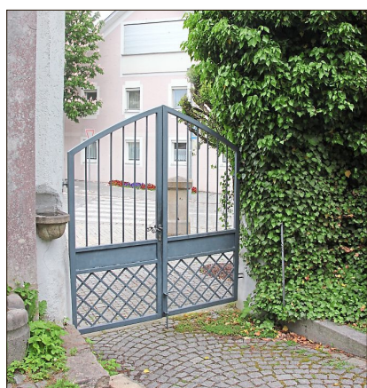
Das aktuelle Eingangstor wird durch das historische Tor ersetzt. Das ist im Bauhof gelagert.

Er vergaß nicht, die Vorteile bei diesem Vorgehen hervorzuheben: „Nur für die Sanierung der Friedhofsmauer hätten wir keine Zuschüsse bekommen und somit die Kosten von einer Million Euro alleine stemmen müssen. So werten wir den gesamten Alten Friedhof auf und zahlen unterm Strich weniger.“