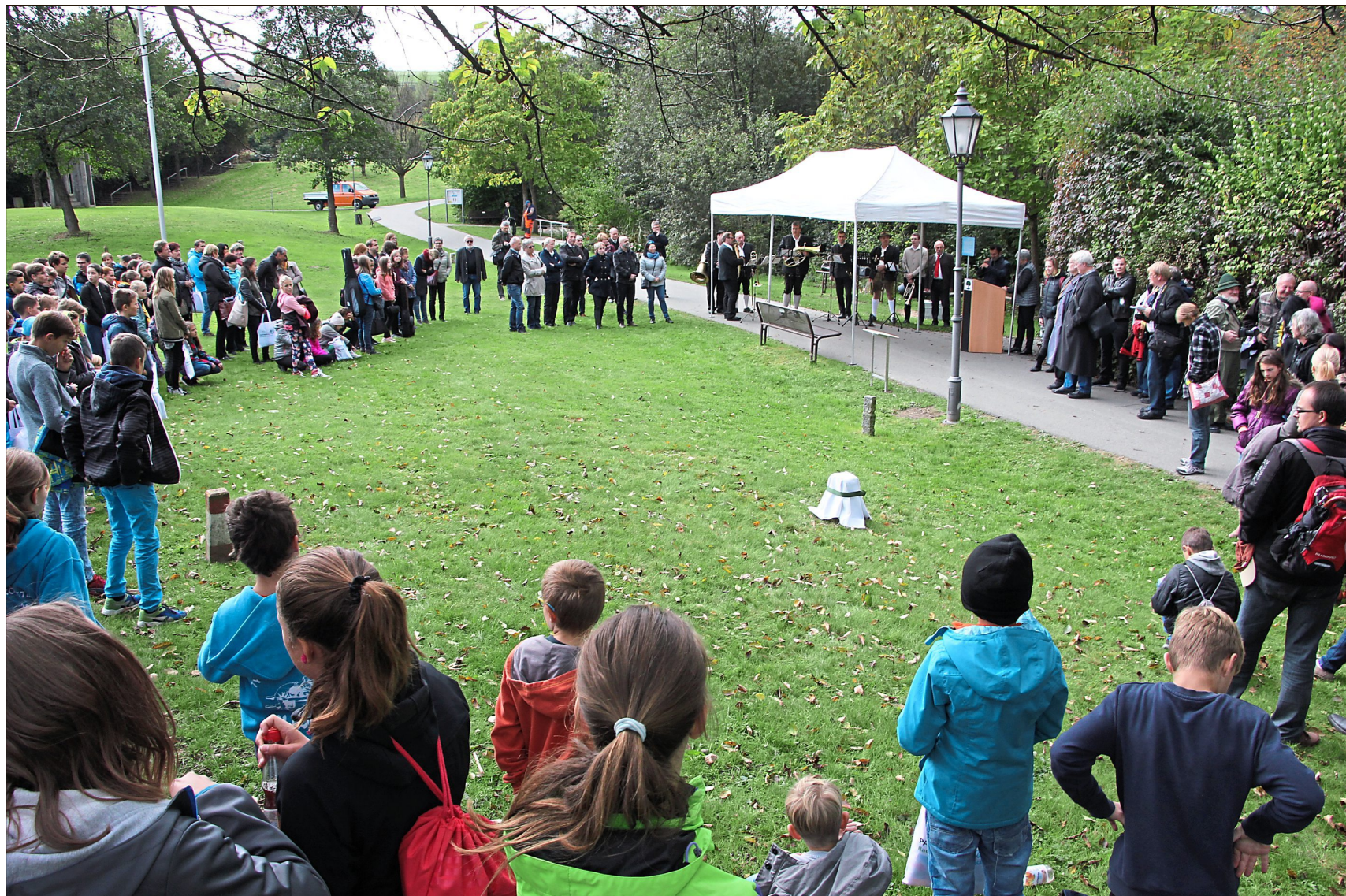
Die Begrüßung im Kurpark war der Auftakt zum zweitägigen Partnerschaftstreffen zwischen Bad Kötzting und Schüttenhofen (Susice).