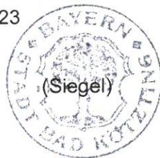
Markus Hofmann Erster Bürgermeister