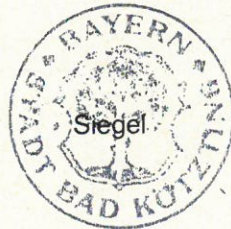
Markus Hofmann Erster Bürgermeister