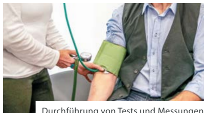
Durchführung von Tests und Messungen