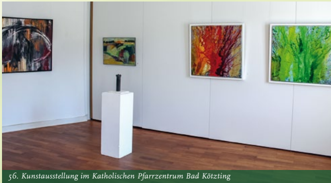
56. Kunstausstellung im Katholischen Pfarrzentrum Bad Kötzting

während der Pfingstferien (21. – 31.05. 2024) von 10 – 17 Uhr