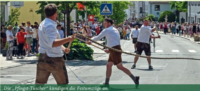
Die „Pfingst-Tuscher“ kündigen die Festumzüge an