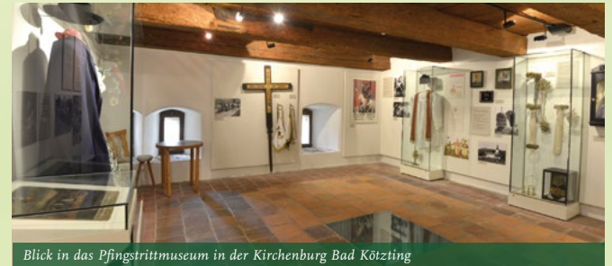
Blick in das Pfingsttrittmuseum in der Kirchenburg Bad Kötzting

während der Pfingstferien (21. – 31.05. 2024) von 10 – 17 Uhr