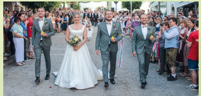
Das Pfingstbrautpaar 2023 und seine Begleiter beim Burschen- und Brautzug

Gemeinsam mit den Burschen zieht dann das Pfingstbrautpaar grüßend durch die festlich geschmückte Stadt zum Hotel „Zur Post“, wo die Pfingsthochzeit gefeiert wird. Die Pfingsthochzeit hat nur symbolischen Charakter. Die Pfingstbraut und die Brautführer müssen wie der Pfingstbräutigam ledig, katholisch und in der Stadt Bad Kötzting wohnhaft sein.