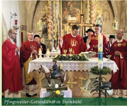
Pfingstreiter-Gottesdienst in Steinbühl