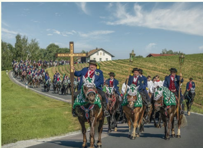
Reiterprozession am Pfingstmontag