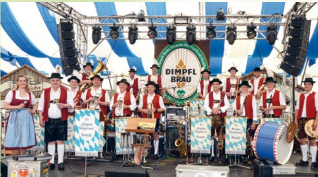
Festkapelle „Die Weiß-Blau Königstreuen“