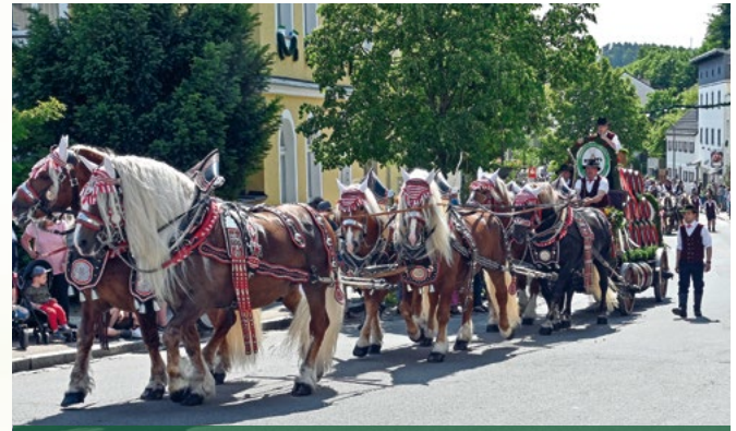
Festzug zur Volksfest-Eröffnung