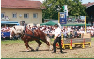
Zugleistungswettbewerb der starken Rösser