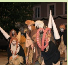
Pfingstl-Spiel in der Innenstadt