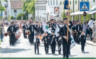
Spielmanszug der FFW Bad Kötztling

„Pfingstfreud' ist ins Land gezogen Volk schließ deine Herzen auf“